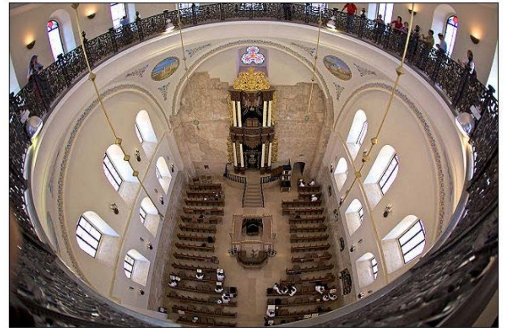
猶太會堂是信徒聚會崇拜的地方、聖經學校、用於讀經和講解律法、禱告的地方、福利機構、平民學校、祭司和教師在此教導。