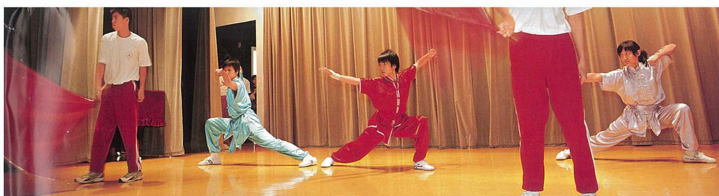
■救世軍石湖學校與基督教崇真中學同學的融合武術演出。

三十位得獎同學能夠克服身體缺陷，發揮潛能，除了依靠個人的努力不懈，家長和老師的悉心教導、關懷、支持和鼓勵亦非常重要。在頒獎禮完滿結束前，大會特別安排一個向家長和老師致謝的環節，向他們送上一瓶小小的蜜糖，寓意學童是家長和老師的「蜜糖」，備受愛護，同時學童的進步令家長和老師有甜蜜的感覺，有如滋潤生命的蜜糖，也盼望這份禮物能為他們帶來甜在心的感覺，實在物輕情義重。